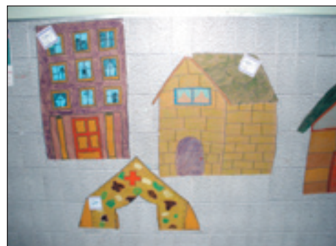
Los niños elaboraron un mural. S.E.