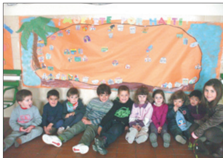
Grupo de alumnos, con el trabajo realizado. S.E.

CENTRO DE ARTE Y NATURALEZA FUNDACIÓN BELLAS, HUESCA