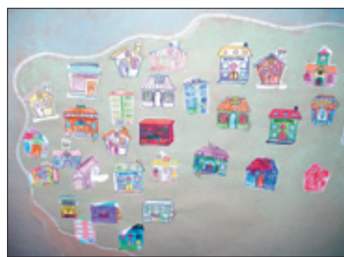
Reconstrucción simbólica de un pueblo haitiano. S.E.